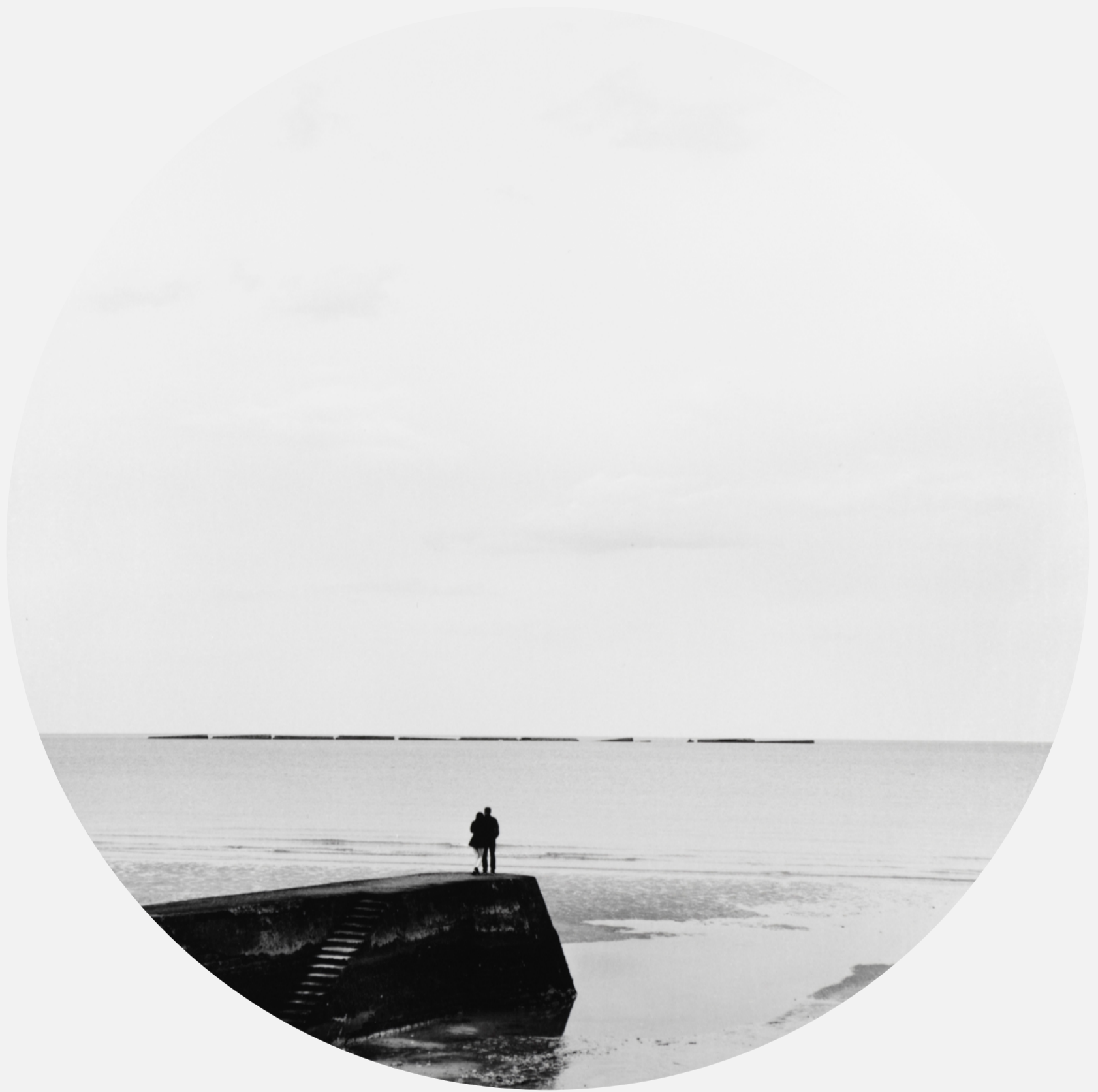
S/T (2019) 42x42cm (imagen 22cm Ø ) Fotografía analógica. Papel cloro-bromuro, virado al selenio.