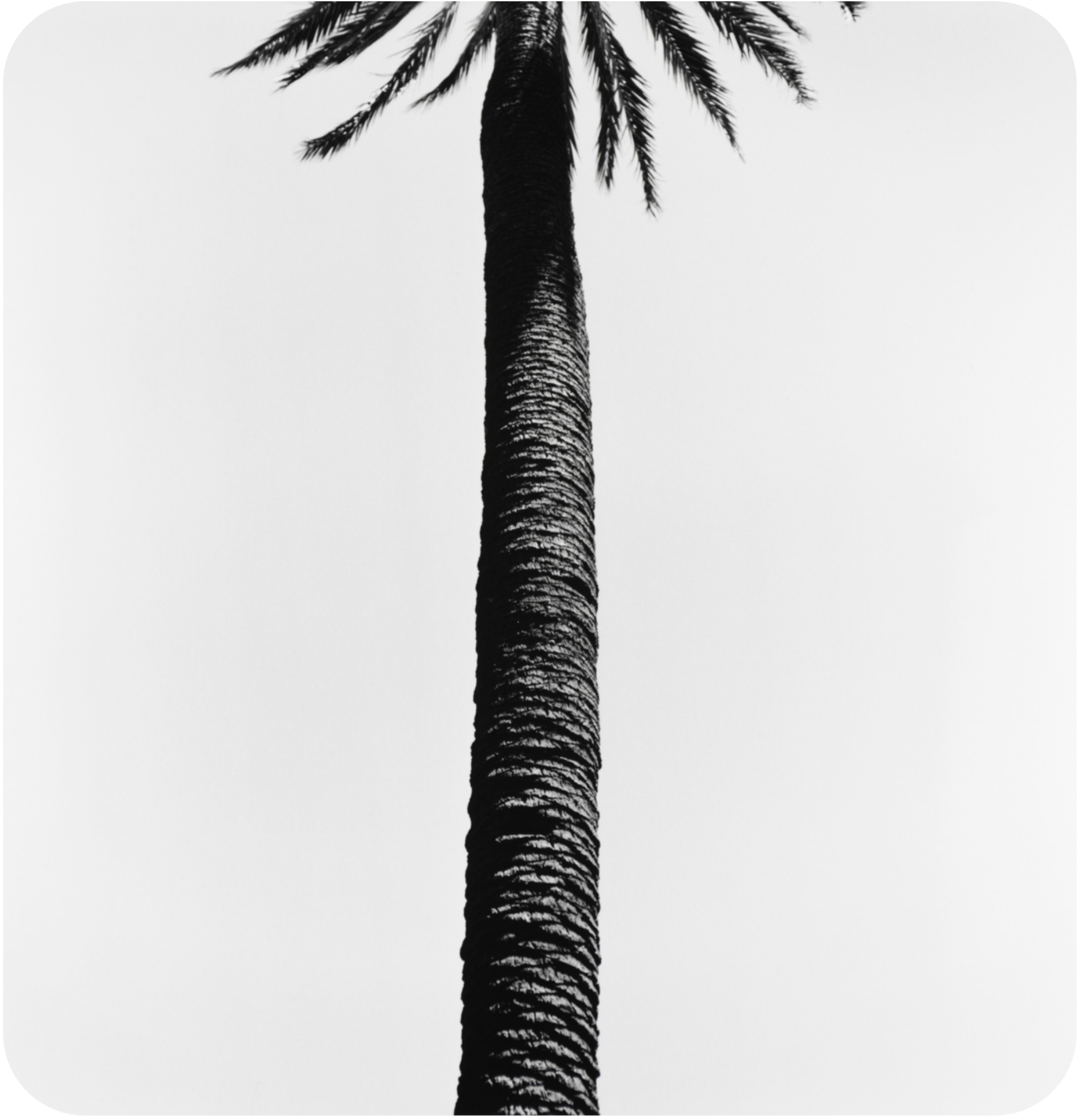
S/T (2016) 42x42cm (imagen 22x22cm) Fotografía analógica. Papel cloro-bromuro, virado al selenio.