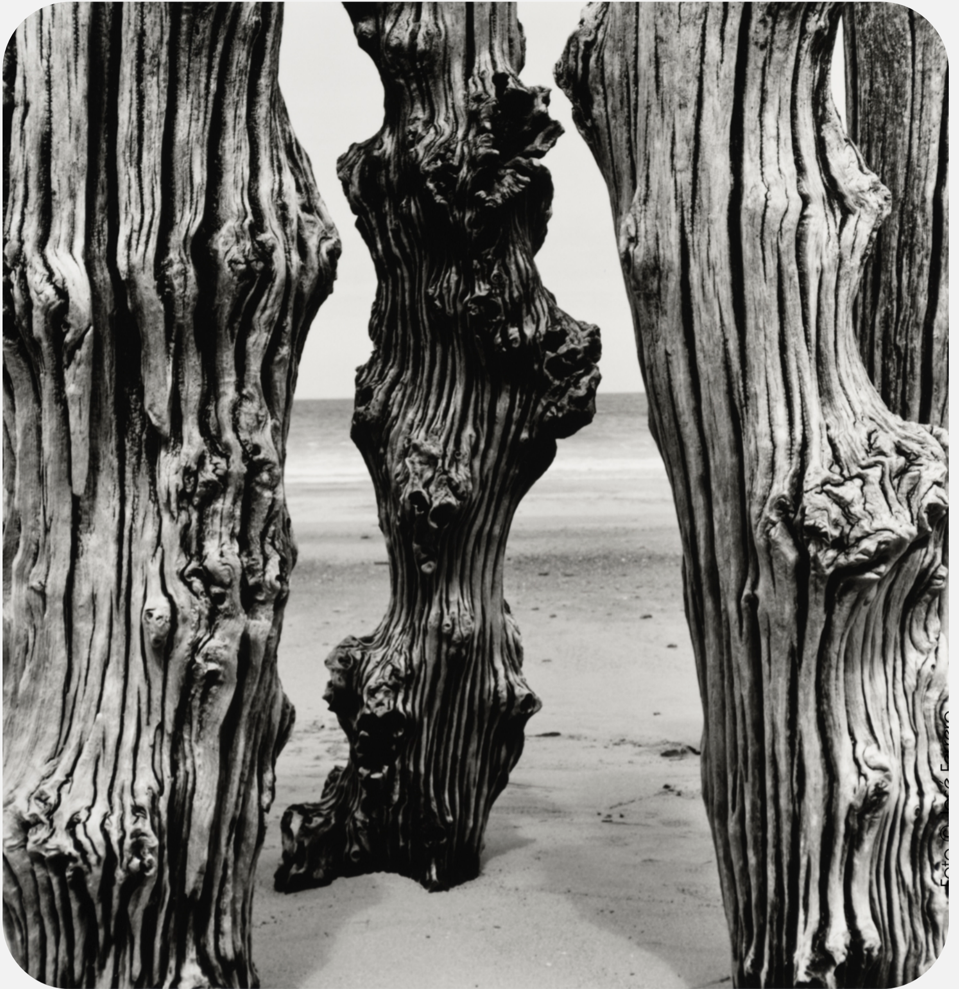
S/T (2016) 42x42cm (imagen 22x22cm) Fotografía analógica. Papel cloro-bromuro, virado al selenio.