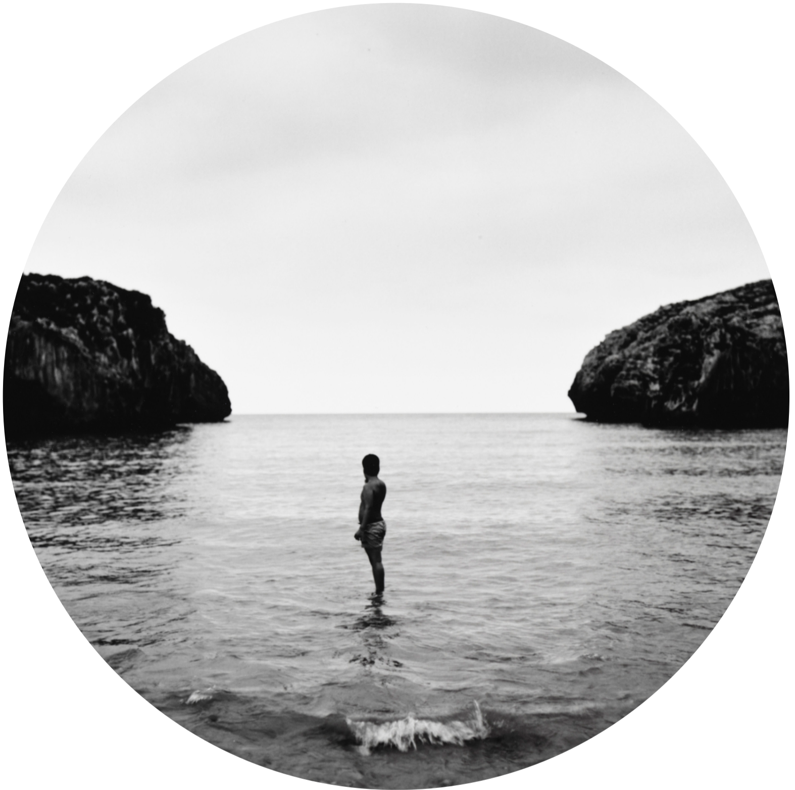
S/T (2011) 42x42cm (imagen 22cm Ø ) Fotografía analógica. Papel cloro-bromuro, virado al selenio.