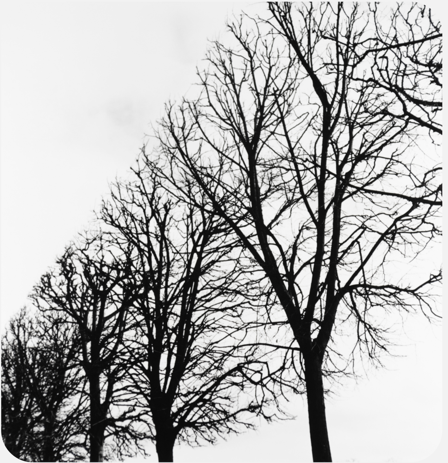
S/T (2017) 42x42cm (imagen 22x22cm) Fotografía analógica. Papel cloro-bromuro, virado al selenio.