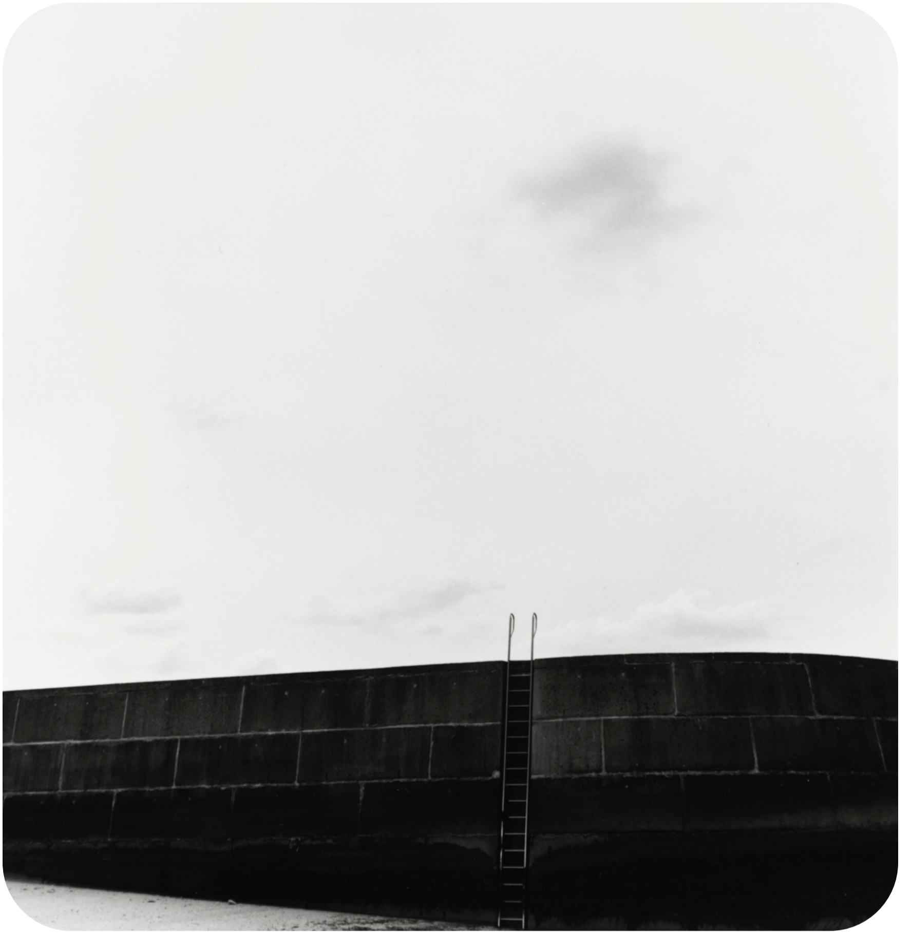
S/T (2019) 42x42cm (imagen 22x22cm) Fotografía analógica. Papel cloro-bromuro, virado al selenio.