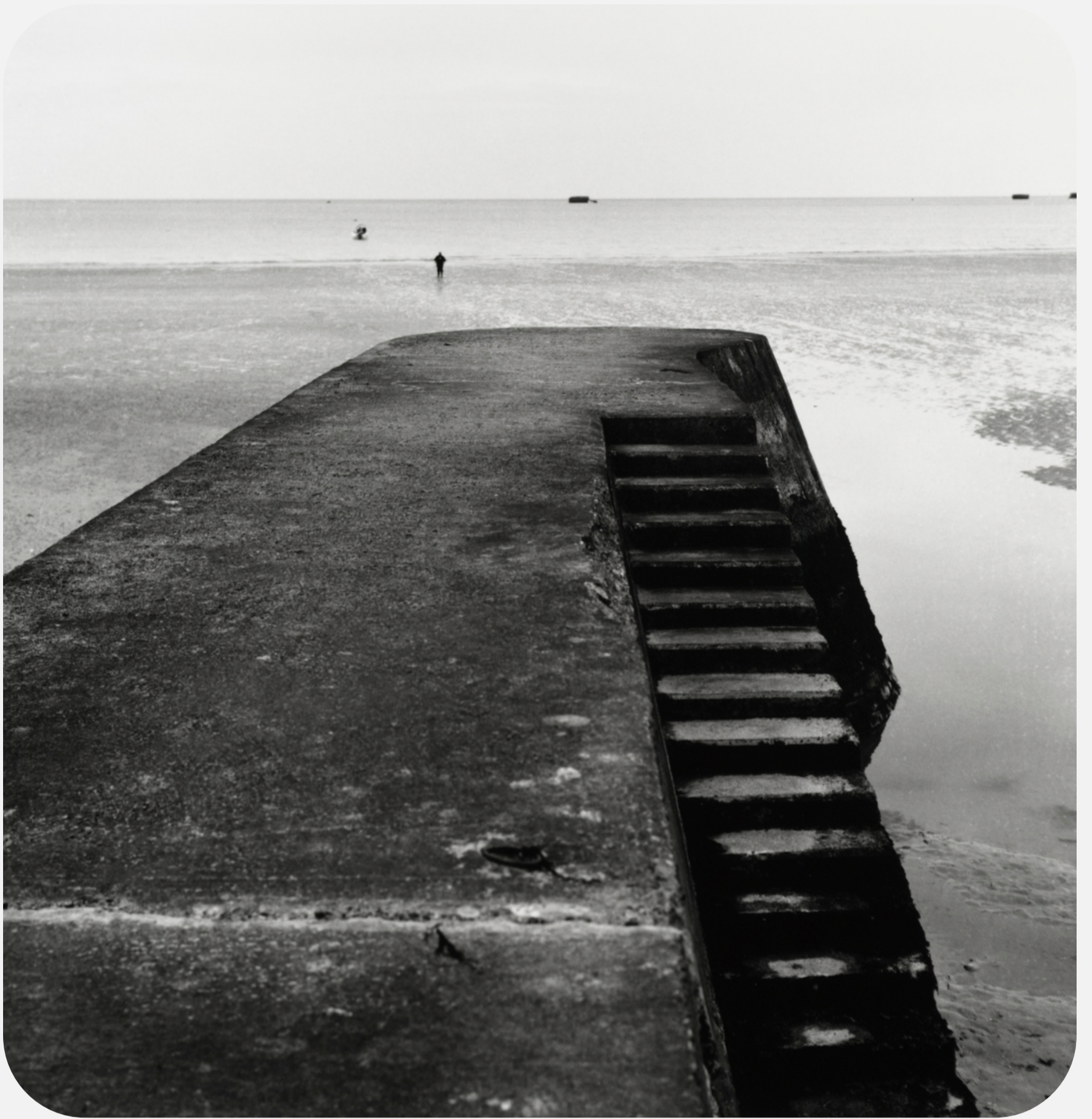
S/T (2019) 30x30cm (imagen 15x15cm) Fotografía analógica. Papel cloro-bromuro, virado al selenio.