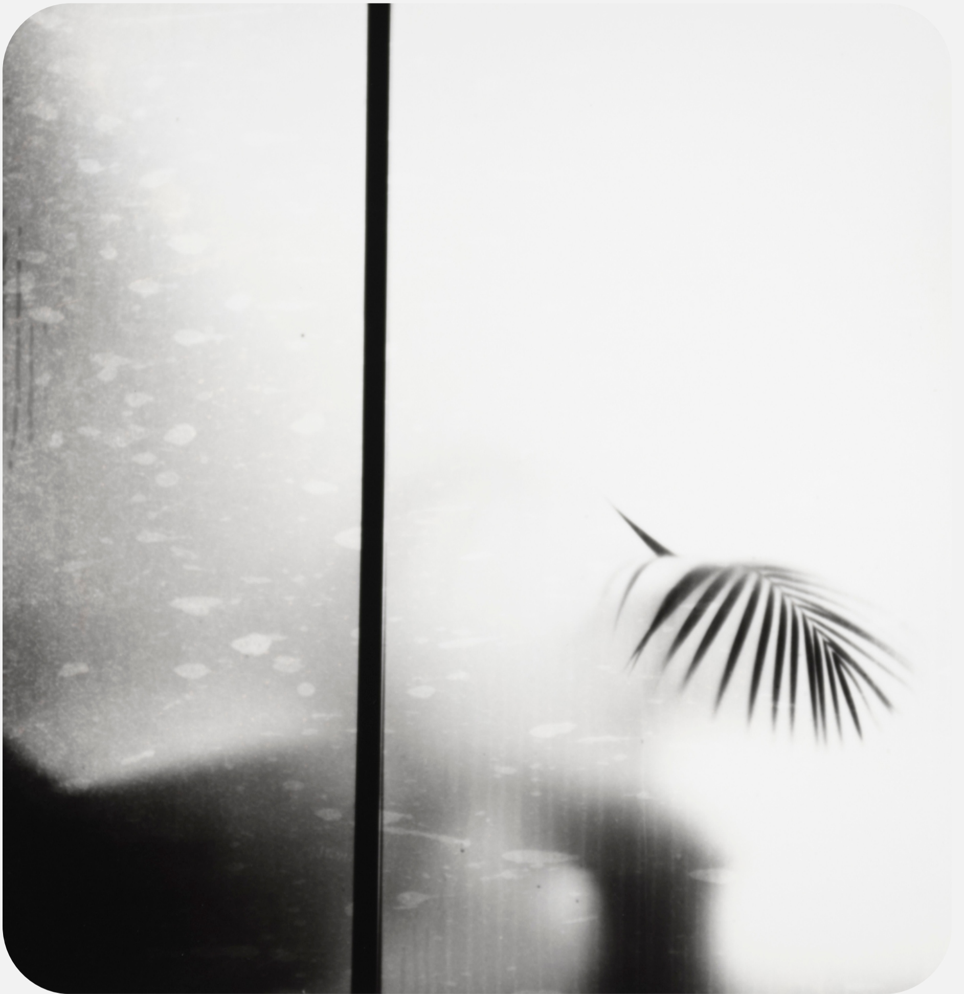
S/T (2019) 30x30cm (imagen 15x15cm) Fotografía analógica. Papel cloro-bromuro, virado al selenio.