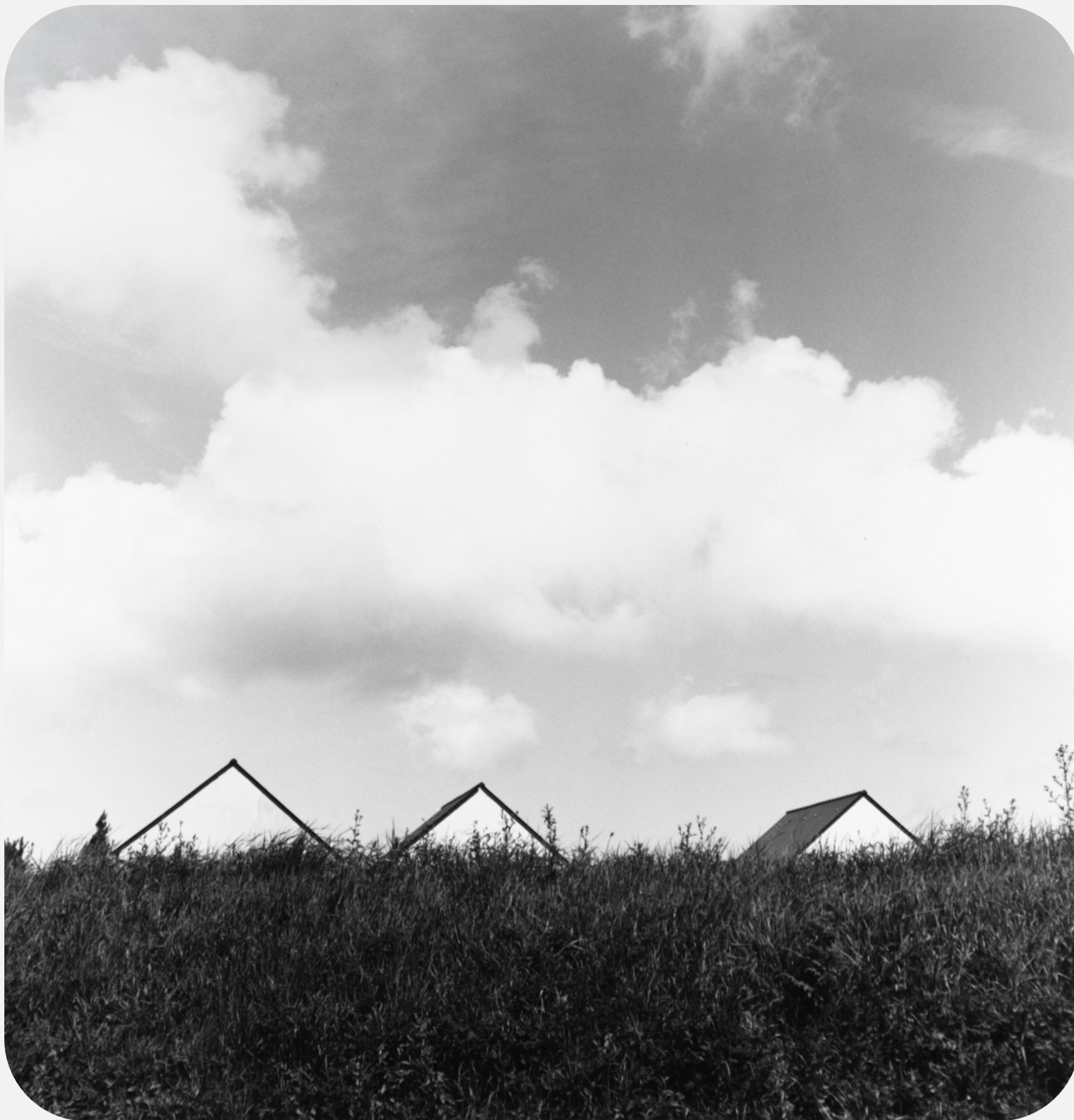
S/T (2016) 42x42cm (imagen 22x22cm) Fotografía analógica. Papel cloro-bromuro, virado al selenio.